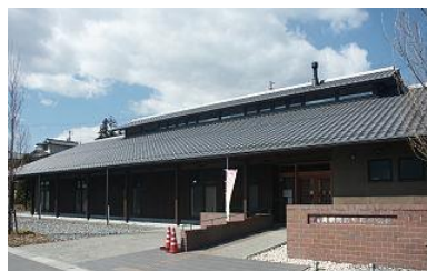
満蒙開拓平和祈念館

香川県からの開拓団及び義勇隊創出状況は、開拓団員数 5,506 人、義勇軍隊員数 2,379 人で、全国で 15 番目の数です。送出数で最も多いのは、長野県です。(※満蒙開拓平和祈念館資料より抜粋) 今回は、この満蒙開拓平和記念館についてご案内します。関心のある方は是非「空の道 7 号」もご覧下さい。