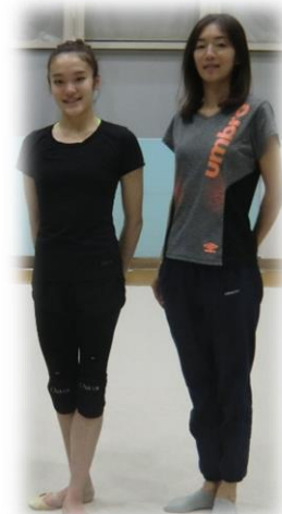
お母様と喜田選手