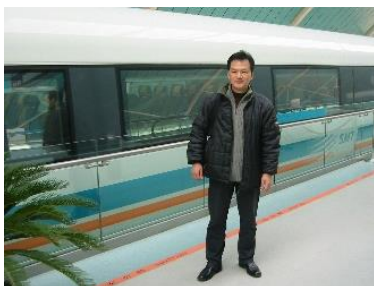
2004年 中国上海 リニアモーターカーと

そしてそんな彼らと出会って交流して思い至った座右の銘は「一期一会」です。彼らから学び、大切にしている私の生きる指針です。現在、お互いに行き来が出来ない状況ですが、来年は明るい未来が待っていることを信じて、新たな仕事の準備を進めたいと思っています。